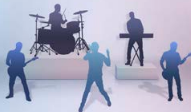
スピーカーX10、サブウーファーX2、アンプ出力770W

入念に考えられたスピーカー配置、デュアルチャンネルのサブウーファーが生み出す、豊かで洗練された音響空間。どちらのシートでも、細部まで鮮明なサウンドを楽しめます。