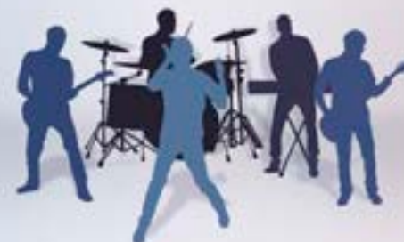
スピーカーX8、サブウーファーX2、アンプ出力380W