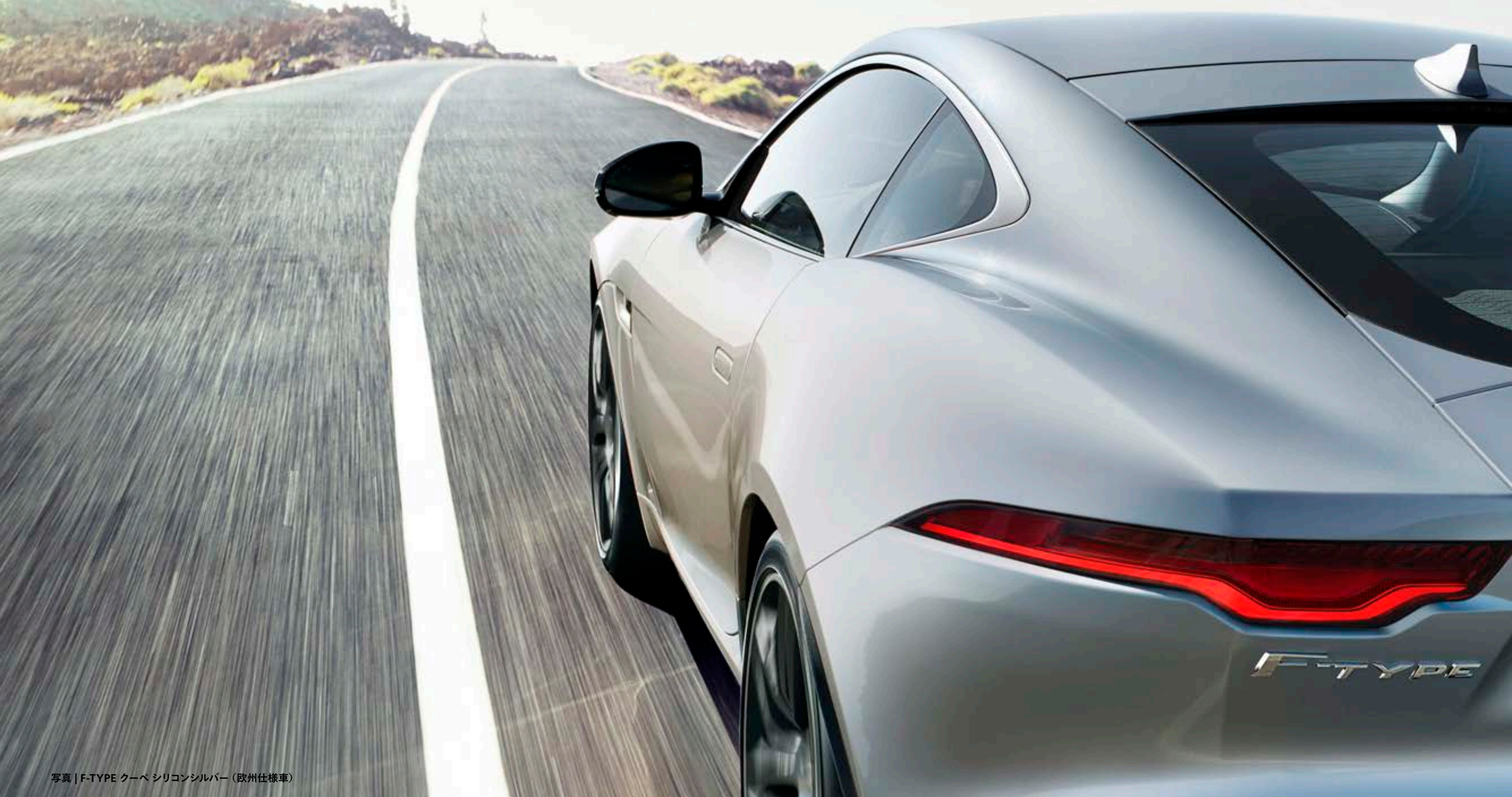
写真 | F-TYPE クーペ シリコンシルバー (欧州仕様車)