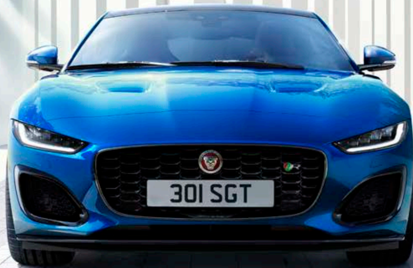
写真 | F-TYPE R クーペ ベロシティブルー (欧州仕様車)

無駄を省き、気品とスポーティな雰囲気にしたF-TYPEのフォルム。美を極めたジャガーのデザインがここにあります。滑らかで印象的なマスクを創り上げているのが、大胆なデザインのフロントグリル。そして独特のパワーバルジとエアベントが際立つ、力強いクラムシェルボンネットです。