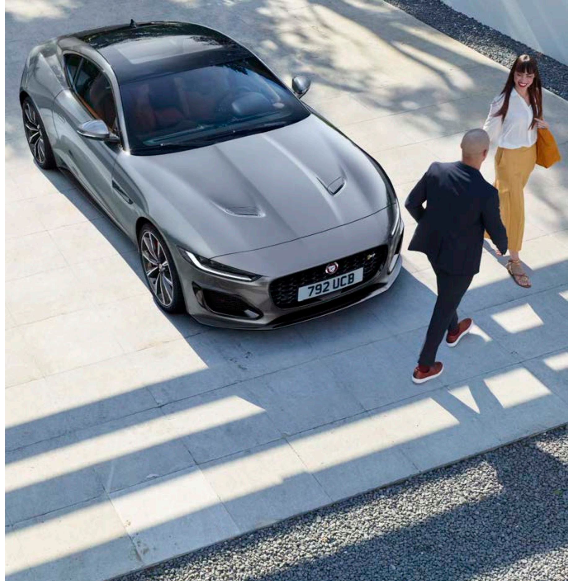
写真 | F-TYPE R クーペ アイガーグレイ (欧州仕様車)

エンジンが停止している間も、F-TYPEが躍動感を失うことはありません。エンジンを覆うように、後方へと力強く延びるボンネット。左右のエアベントからも、この車に秘められたパワーが感じられます。フェンダーベントに浮かび上がるジャガーリーパー。パフォーマンスを追求しながら最大限に魅せる、ジャガーのデザイン哲学を貫いています。