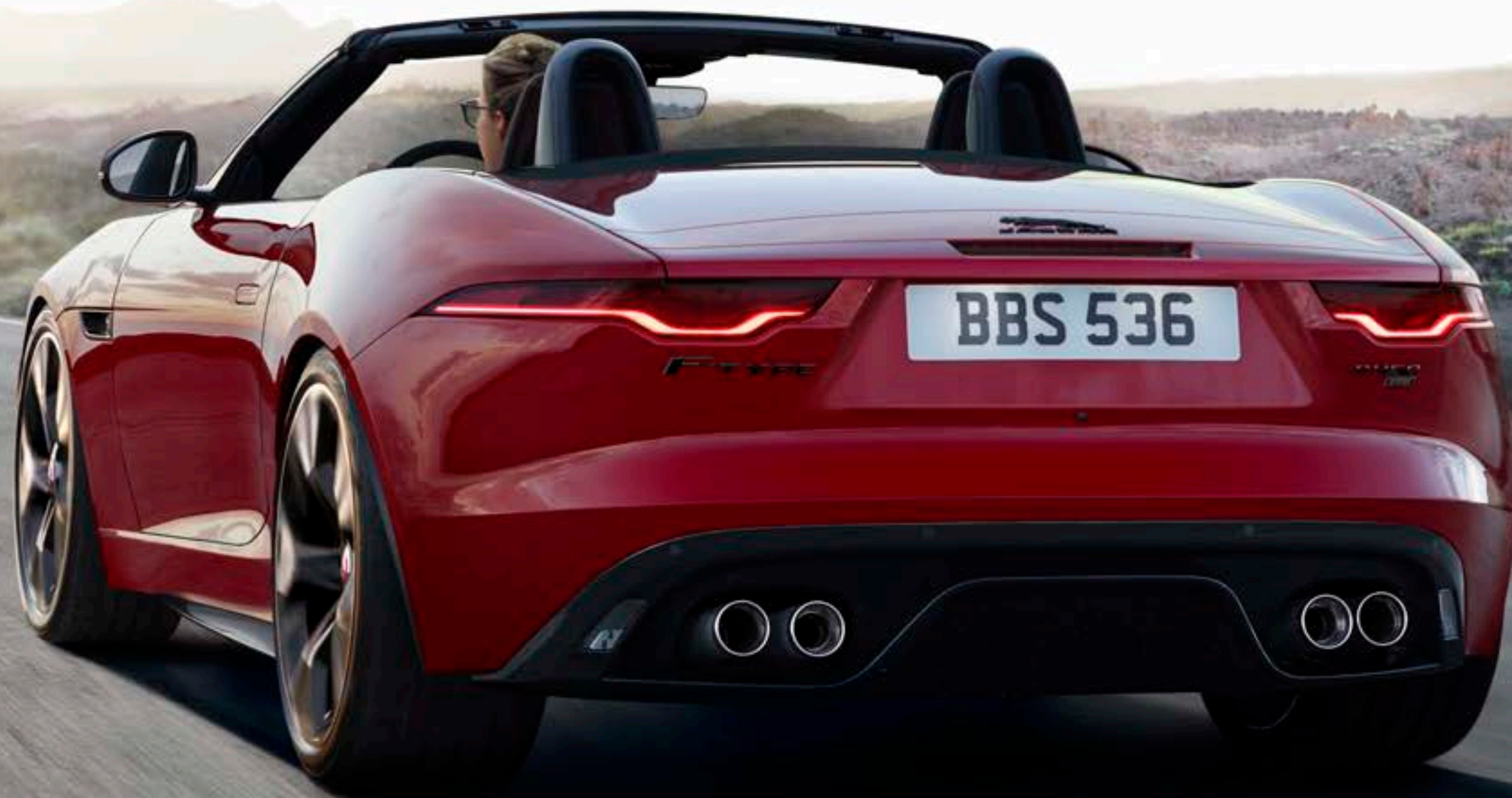
写真 | F-TYPE R-Dynamic コンバーチブル フィレンツェレッド: ブラックエクステリアパック装着 (欧州仕様車)

卓越した空力性能により、エアフローを正確にコントロールするF-TYPEのボディライン。 リアスポイラーは、速度の上昇に合わせて展開し、揚力を抑えて安定性をいっそう高めます。