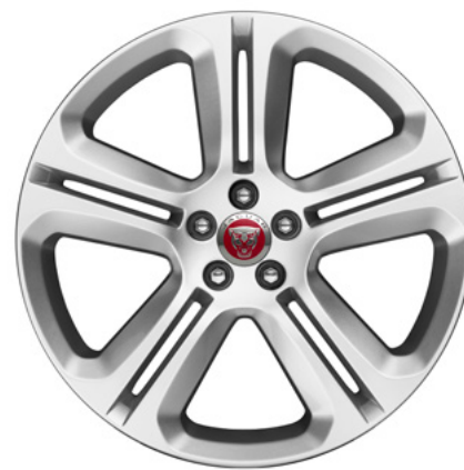
20" スタイル5036, 5スプリットスポーク, グロスパークルシルバー