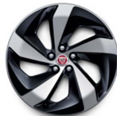
19" スタイル5103, 5スポーク, グロスブラック コントラストダイヤモンドターンドフィニッシュ