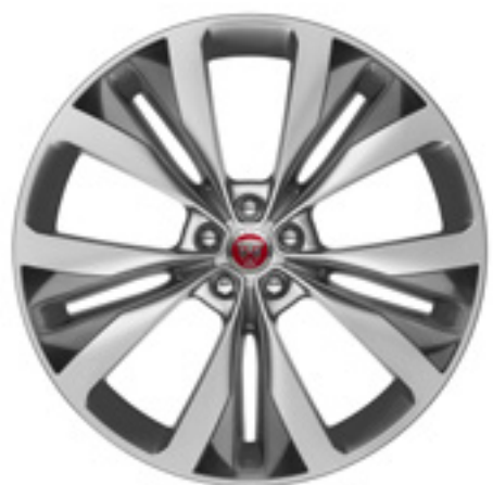
22" スタイル1020, 15スポーク, グロスシルバー コントラストインサート