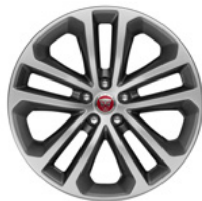
19" スタイル5038, 5スプリットスポーク, グロスグレイ コントラストダイヤモンドターンドフィニッシュ