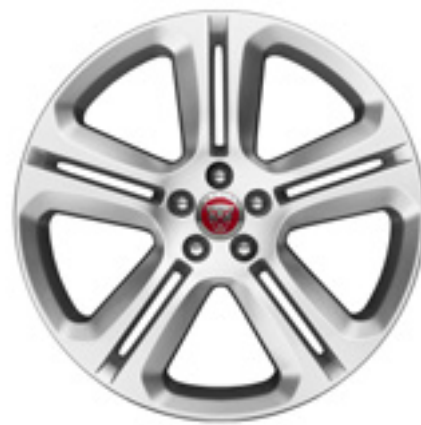
20" スタイル5036, 5スプリットスポーク, グロススパークルシルバー