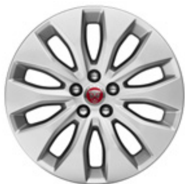
18" スタイル1021, 10スポーク, グロススパークルシルバー

現代的でダイナミックなデザインのアロイホイールのバリエーションで、あなたのクルマにさらなる個性を。