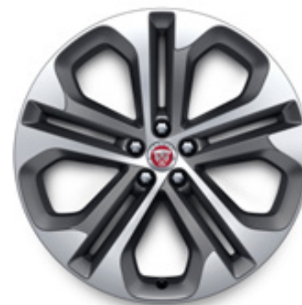
21" スタイル5104, 5スプリットスポーク, サテンダークグレイ コントラストダイヤモンドターンドフィニッシュ