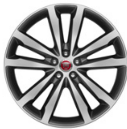
20" スタイル5031, 5スプリットスポーク, グロスグレイ コントラストダイヤモンドターンドフィニッシュ