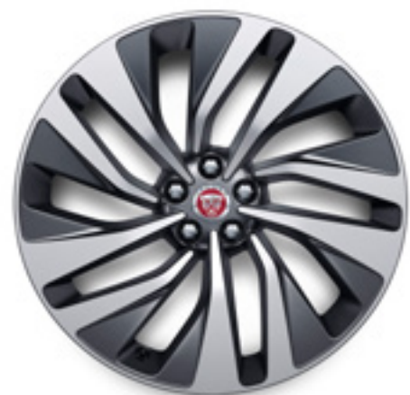
21" スタイル1068, 10スポーク, サテンダークグレイ コントラストダイヤモンドターンドフィニッシュ

現代的でダイナミックなデザインのアロイホイールのバリエーションで、あなたのクルマにさらなる個性を。