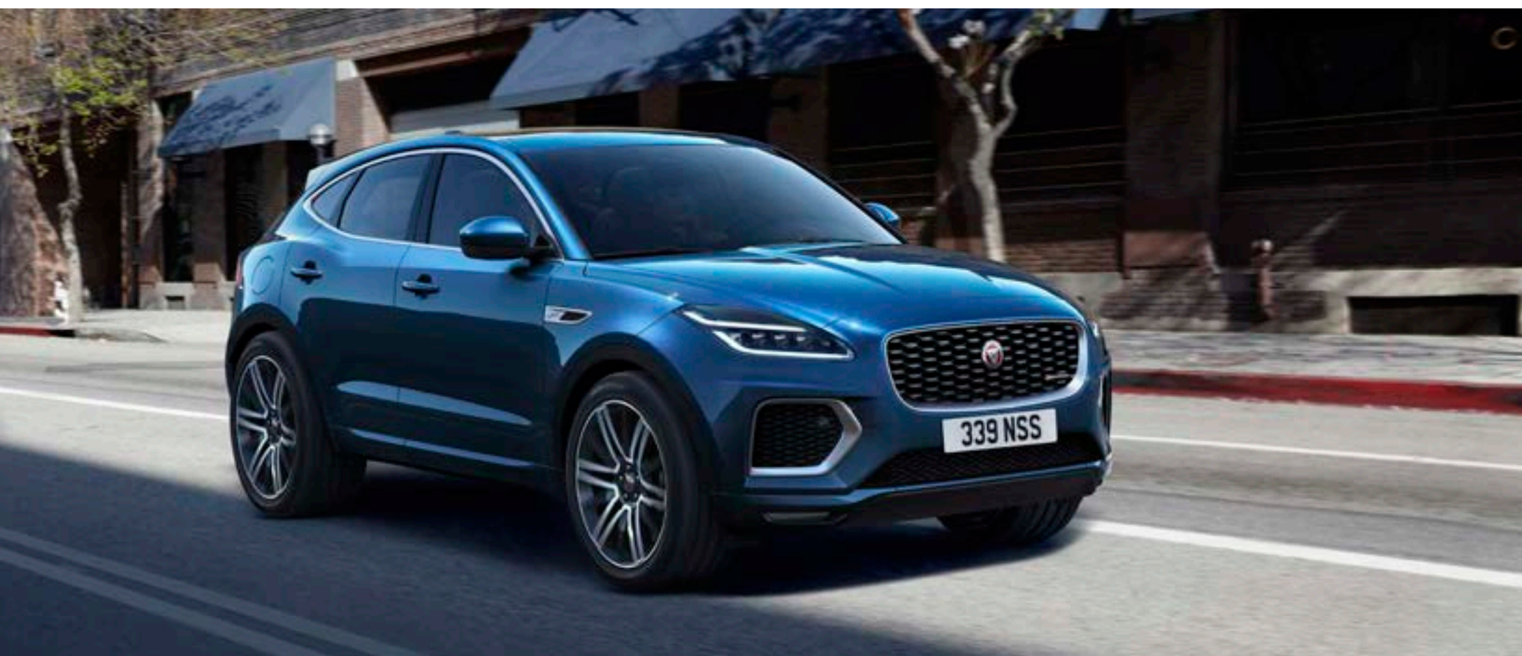
写真 | E-PACE SE フジホワイト (欧州仕様車)、E-PACE R-Dynamic HSE ブルーファイヤーブルー (欧州仕様車)

E-PACE R-Dynamicは、さらにスポーティな魅力を追及しました。エクステリアには、存在感を放つダイヤモンドターンドフィニッシュのホイールとサテンシャドーアトラスのグリル。インテリアには、エボニースエードクロスヘッドライニング、スポーツシート、コントラストステッチを採用し、R-Dynamicロゴを随所に施しました。