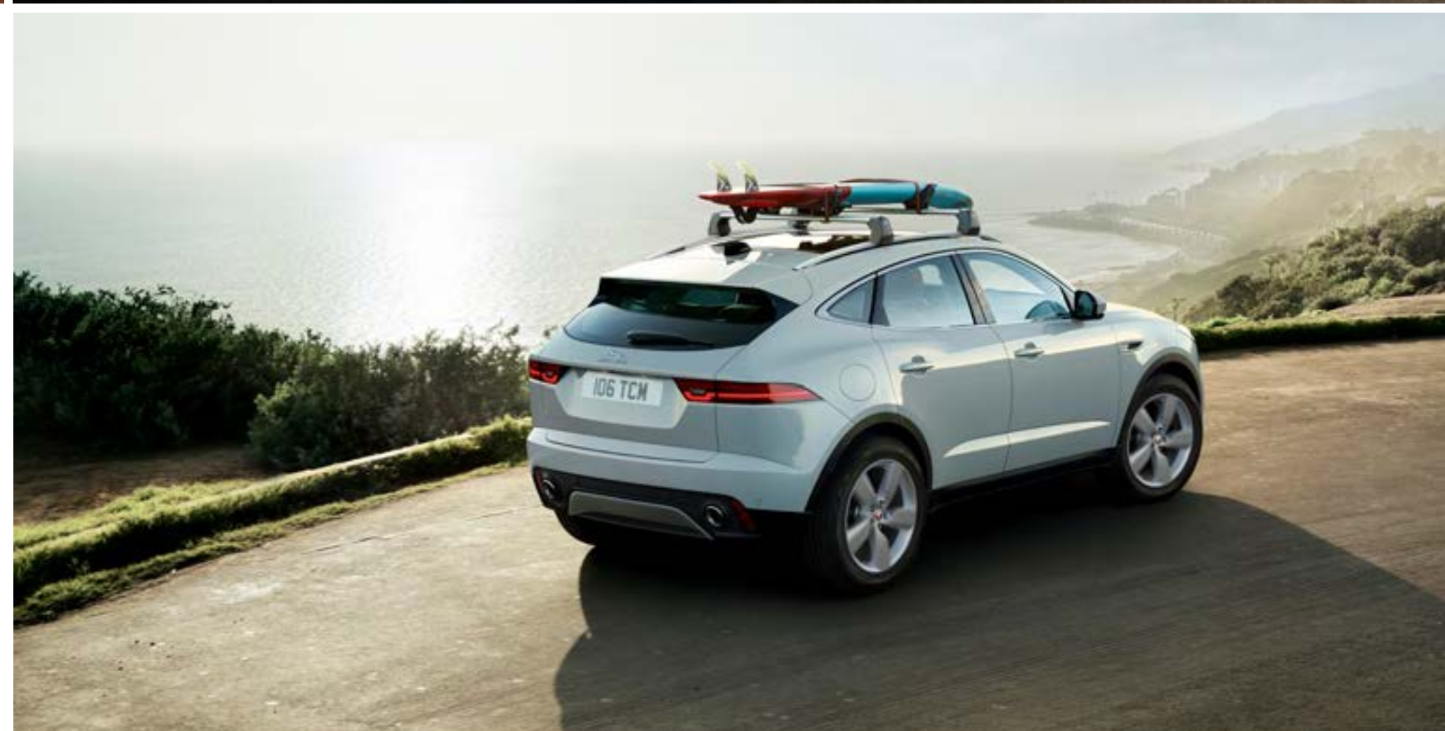
写真 | E-PACE SE フジホワイト (欧州仕様車)

*アクティビティキーは約2時間で充電が完了。1回の充電で最長10日間使用できます。