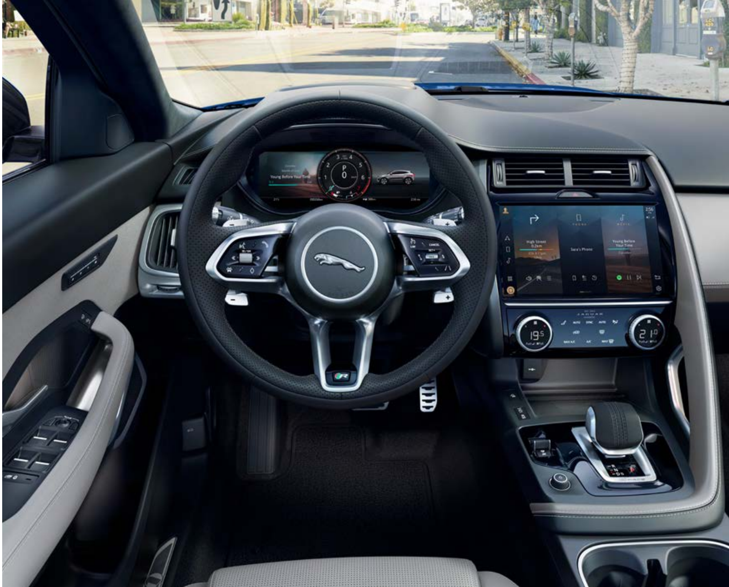
写真 | E-PACE R-Dynamic HSE: クラウドパーフォレイテッドウィンザーレザースポーツシート (エボニー / クラウドインテリア) (欧州仕様車)

ドライバーは安全が確保された状況でのみ車内機能を使用してください。ドライバーは、常に車両を安全に制御できる状態を保つ必要があります。