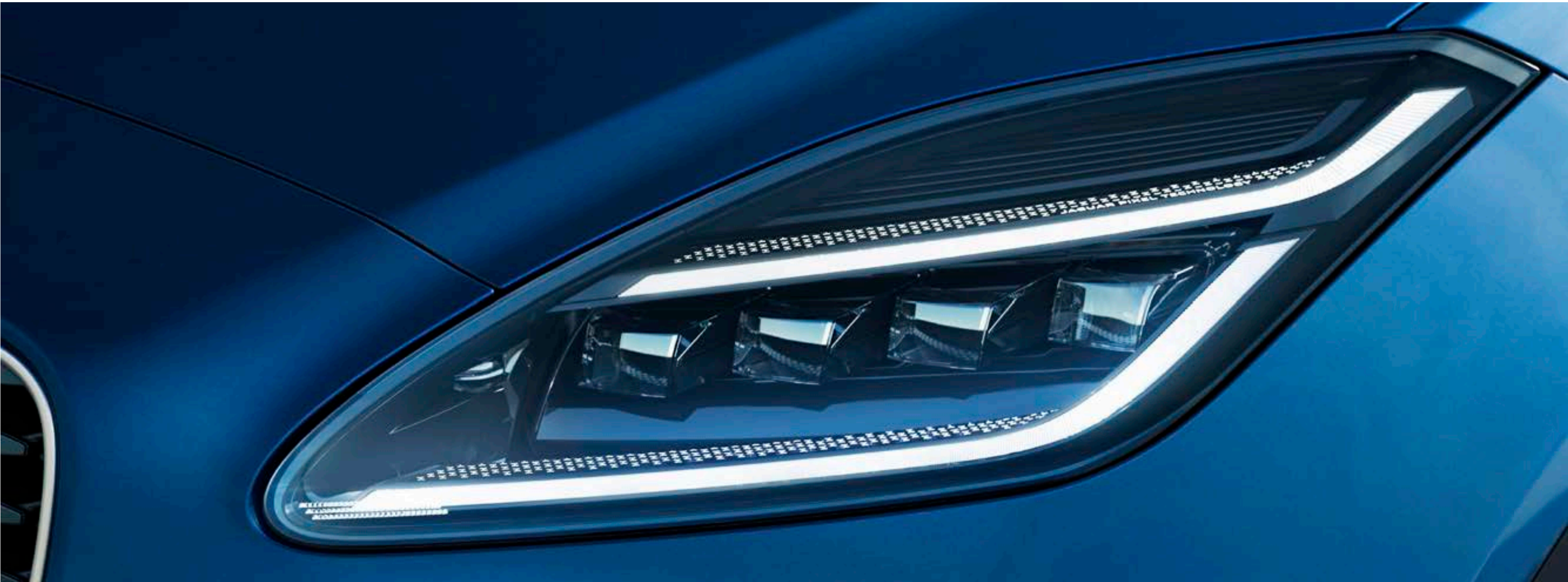
写真 | E-PACE R-Dynamic HSE ブルーファイヤーブルー（欧州仕様車）