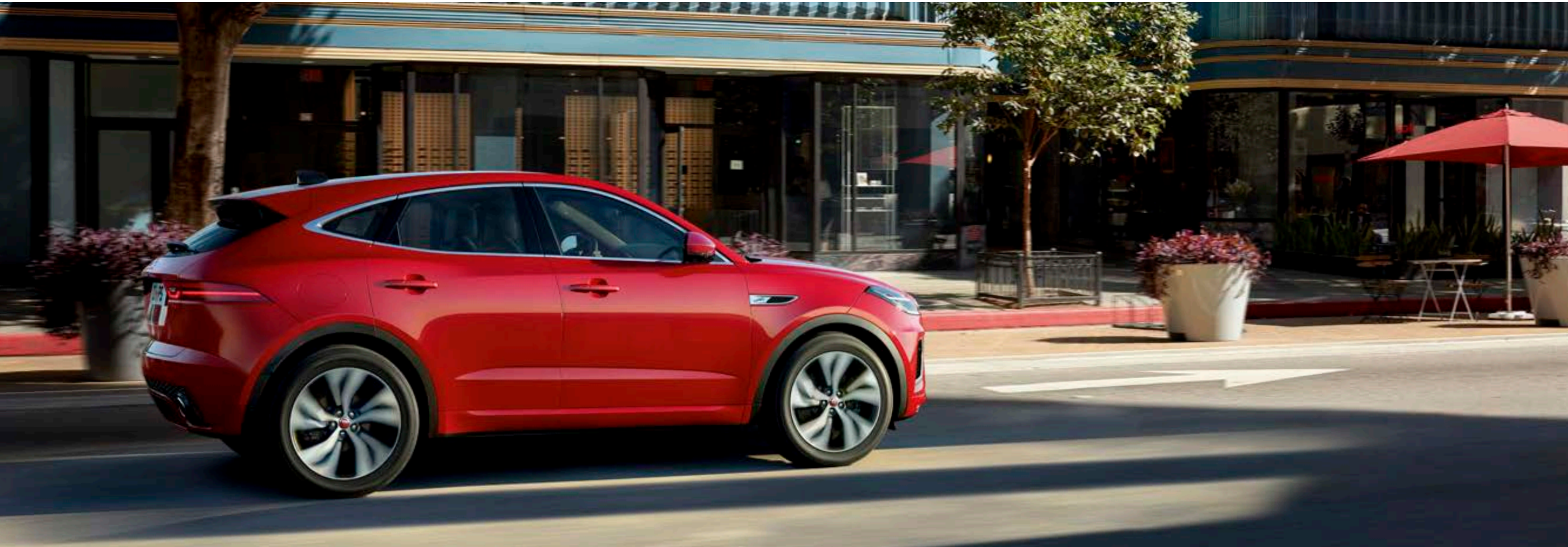
写真 | E-PACE R-Dynamic HSE カルデラレッド (欧州仕様車)

重視するのはパワー、爽快感、それとも効率性でしょうか。E-PACEでは、ドライビングスタイルに合わせて、4気筒ガソリンエンジン、マイルドハイブリッド (MHEV) テクノロジーを採用した4気筒ディーゼルエンジンをお選びいただけます。MHEVは低速での減速時にエンジンを停止し、運動エネルギーを回収してバッテリーに充電。特に市街地走行での効率が向上します。