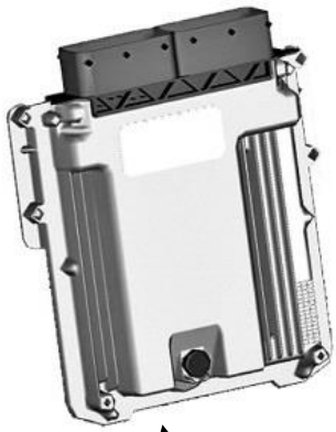
パワートレイン コントロールユニット